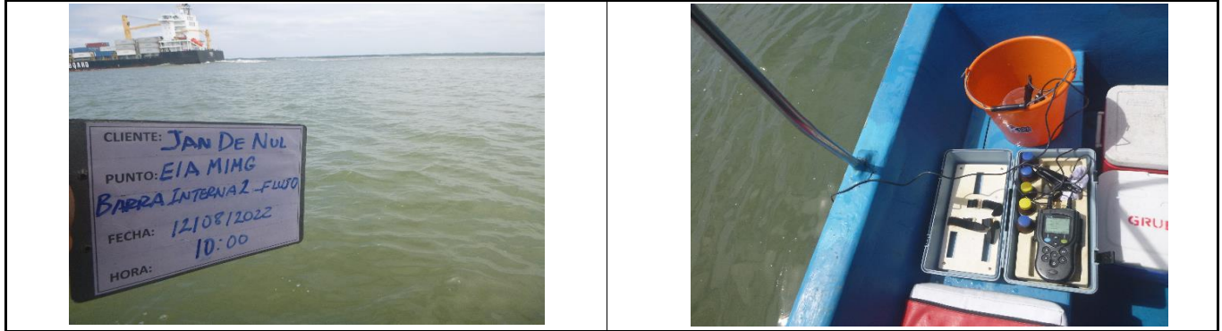
Fotografía 1. Panorámica del área de toma de muestra