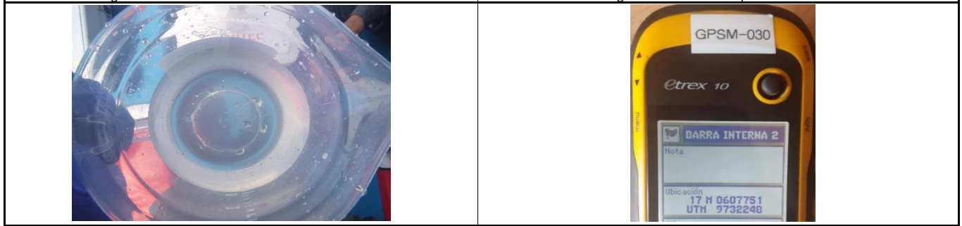
Fotografía 3. Apariencia de la muestra