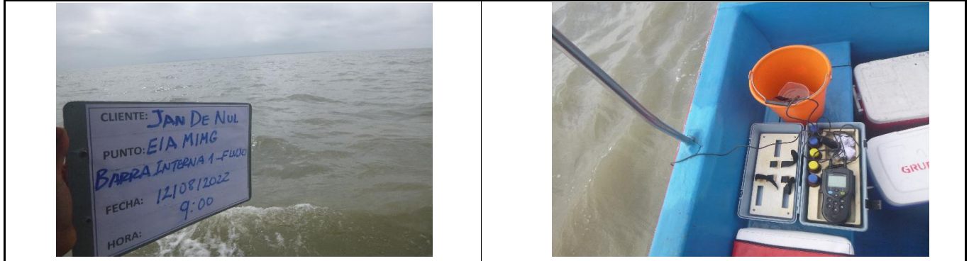
Fotografía 1. Panorámica del área de toma de muestra