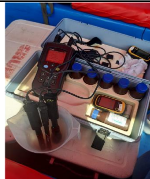
Fotografía 2. Medición de parámetros in situ