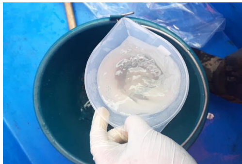
Fotografía 3. Apariencia de la muestra