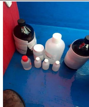
Fotografía 4. Muestra rotulada, envasada y preservada

091 041 454 841 041 110005A 091 041 454 841 041 110005A 091 041 454 841 041 110005A 091 041 454 841 041 110005A 091 041 454 841 041 110005A 091 041 454 841 041 110005A 091 041 454 841 041 110005A 091 041 454 841 041 110005A