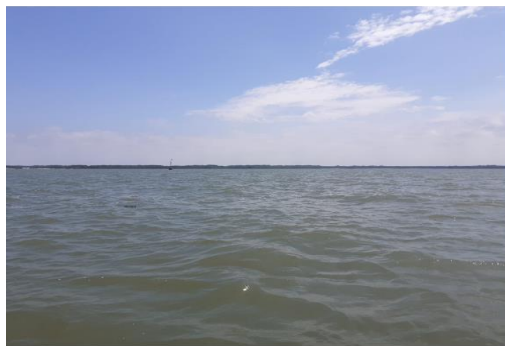
Fotografía 1. Panorámica del área de toma de muestra