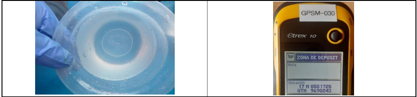
Fotografía 3. Apariencia de la muestra