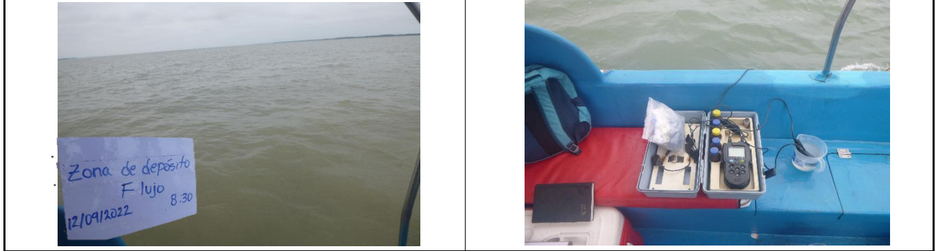
Fotografía 1. Panorámica del área de toma de muestra