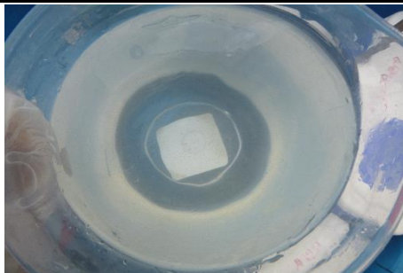
Fotografía 3. Apariencia de la muestra