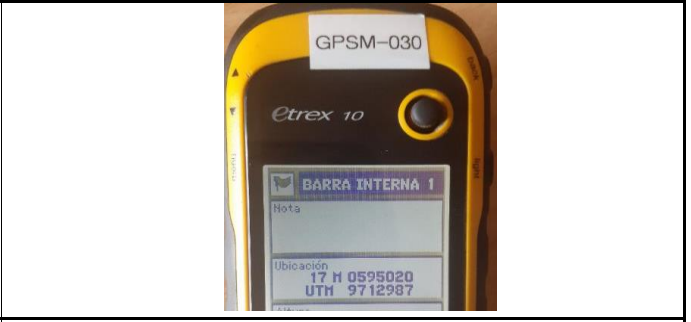
Fotografía 4. Coordenadas geográficas

081 641 462 462 1) eÁ (1) 08085800V0CE 000V08800U0QE 0) 641 M08085800V0800U08800A 00U080800A M0000000Y0808080808 (1) M08080808080000V080808080808 08080808080808080808080808080808 T (08) 10-8 108 11 080 11 08 11 08 V08080808080808080808080808080808 08080808080808080808080808080808