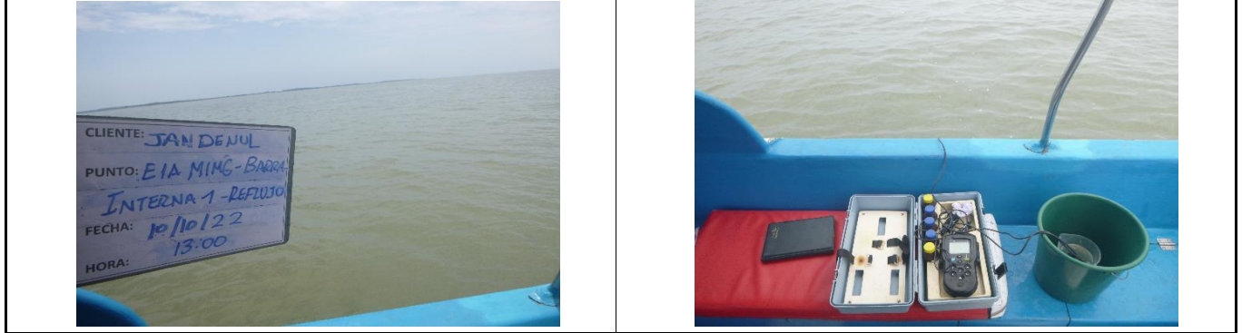
Fotografía 1. Panorámica del área de toma de muestra