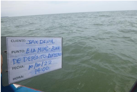
Fotografía 1. Panorámica del área de toma de muestra