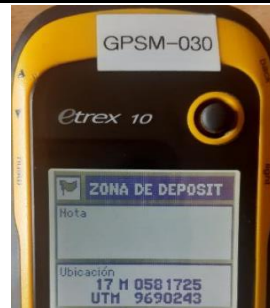
Fotografía 4. Coordenadas geográficas