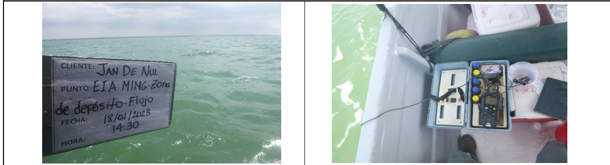
Fotografía 1. Panorámica del área de toma de muestra