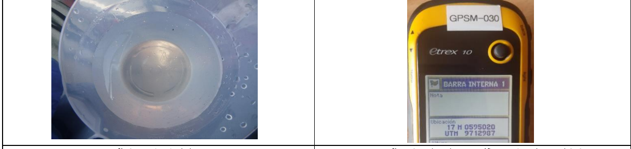
Fotografía 3. Apariencia de la muestra Fotografía 4. Coordenadas geográficas registrada con el GPS