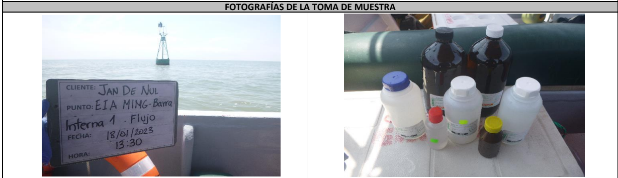
Fotografía 1. Panorámica del área de toma de muestra Fotografía 2. Muestra rotulada, envasada y preservada