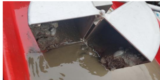
Fotografía 2. Uso de draga tipo Van Veen y apariencia de la muestra