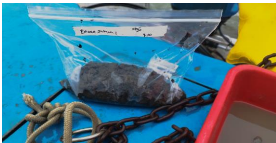
Fotografía 3. Homogenización de la muestra