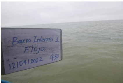
Fotografía 1. Panorámica del sitio de toma de muestra