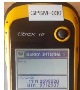
Fotografía 4. Coordenada geográfica

0123456789 ABCDEFGHIJK LMNOPQRSTUVWXYZ [ ] ^ _ ` a b c d e f g h i j k l m n o p q r s t u v w x y z