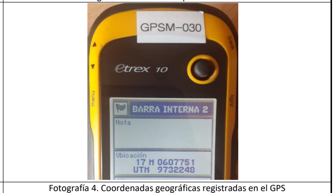
Fotografía 4. Coordenadas geográficas registradas en el GPS