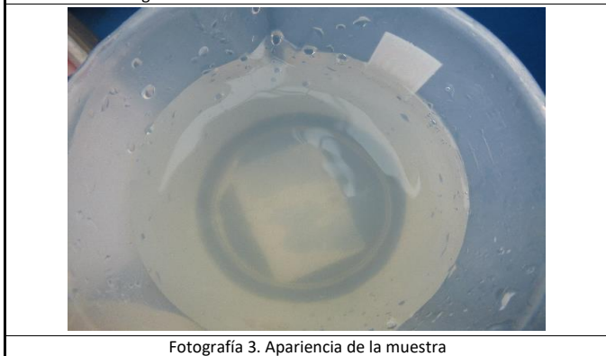
Fotografía 3. Apariencia de la muestra