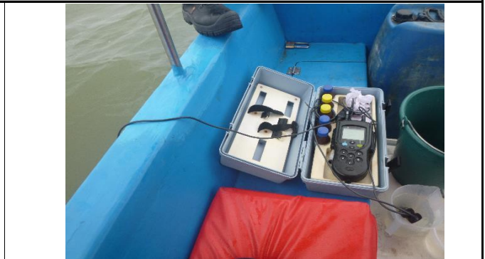
Fotografía 2. Medición de parámetros in situ