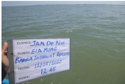
Fotografía 1. Panorámica del sitio de toma de muestra