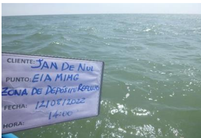
Fotografía 1. Panorámica del sitio de toma de muestra