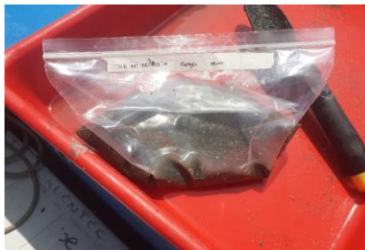
Fotografía 3. Homogenización de la muestra