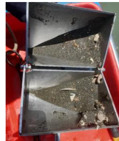
Fotografía 2. Uso de draga tipo Van Veen y apariencia de la muestra