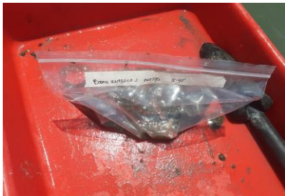
Fotografía 3. Homogenización de la muestra