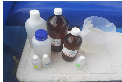
Fotografía 4. Muestra rotulada, envasada y preservada

0123456789 0123456789 0123456789 0123456789