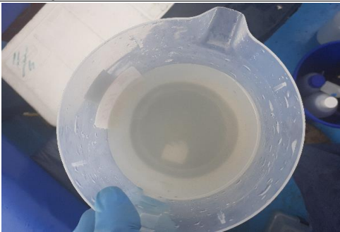
Fotografía 3. Apariencia de la muestra