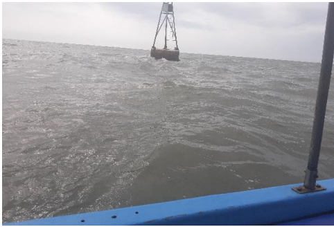
Fotografía 1. Panorámica del área de toma de muestra