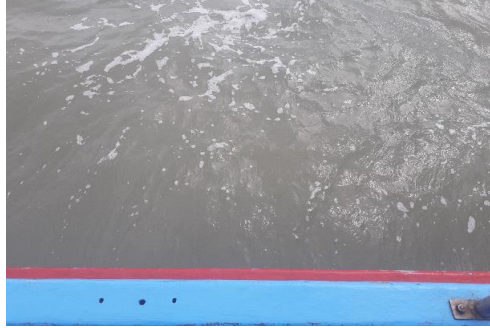
Fotografía 2. Sitio de toma de muestra