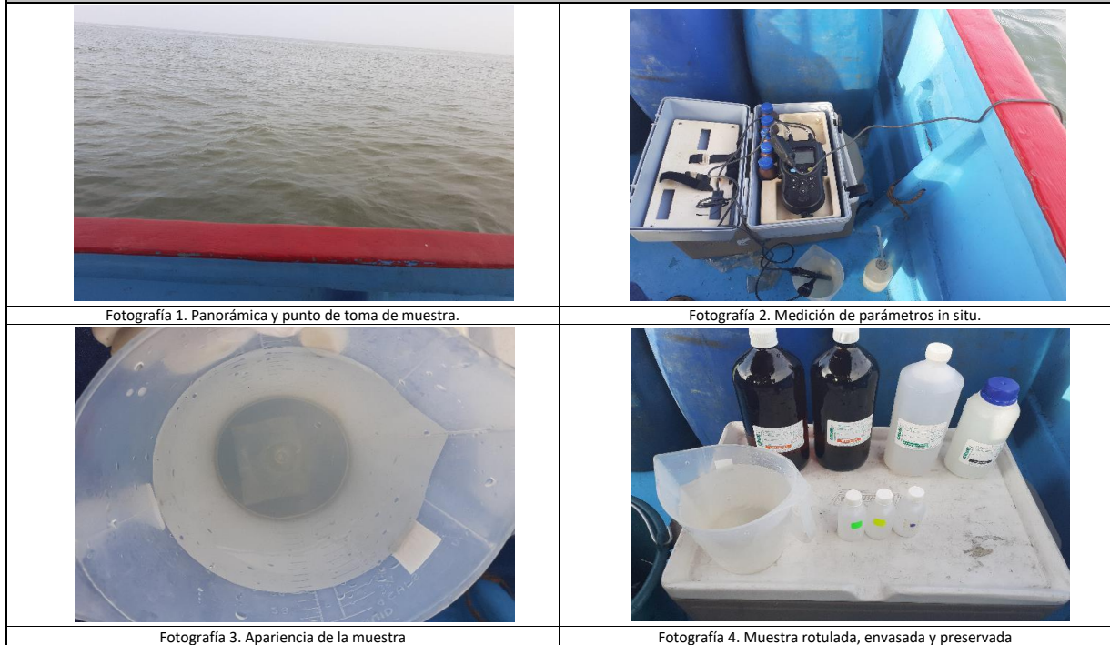
Fotografía 1. Panorámica y punto de toma de muestra.