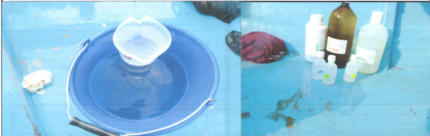
Fotografía 1. Vista lateral