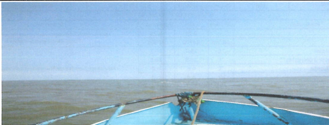
Fotografía 3. Vista panorámica del punto de muestreo