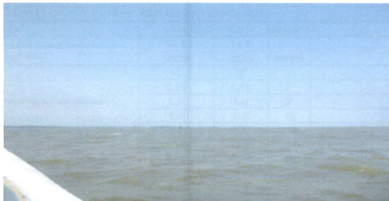
Fotografía 3. Vista panorámica del punto de muestreo

Ing. Isabel Estrella Gerente de Operaciones