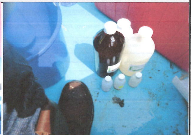
Fotografía 2. Vista frontal