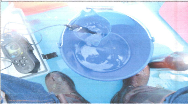
Fotografía 1. Vista lateral