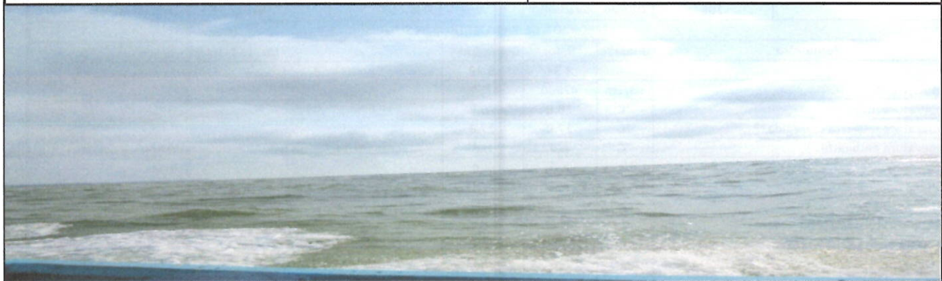
Fotografía 3. Vista panorámica del punto de muestreo