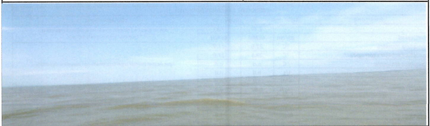
Fotografía 3. Vista panorámica del punto de muestreo

Ing. Isabel Estrella Gerente de Operaciones