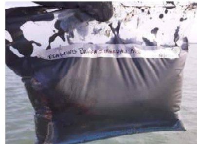
Fotografía 2. Muestra en funda ziploc