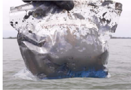
Fotografía 2. Muestra en funda ziploc