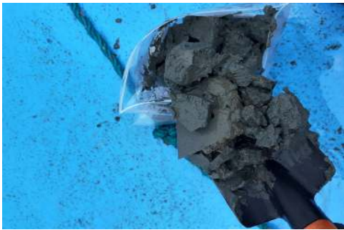
Fotografía 1. Apariencia de la muestra