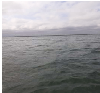
Fotografía 3. Sitio de muestreo (Alta mar)