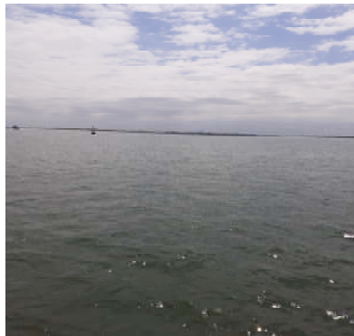
Fotografía 3. Sitio del muestreo (Altama mar)