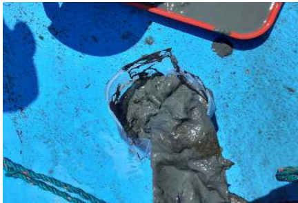
Fotografía 1. Apariencia de la muestra