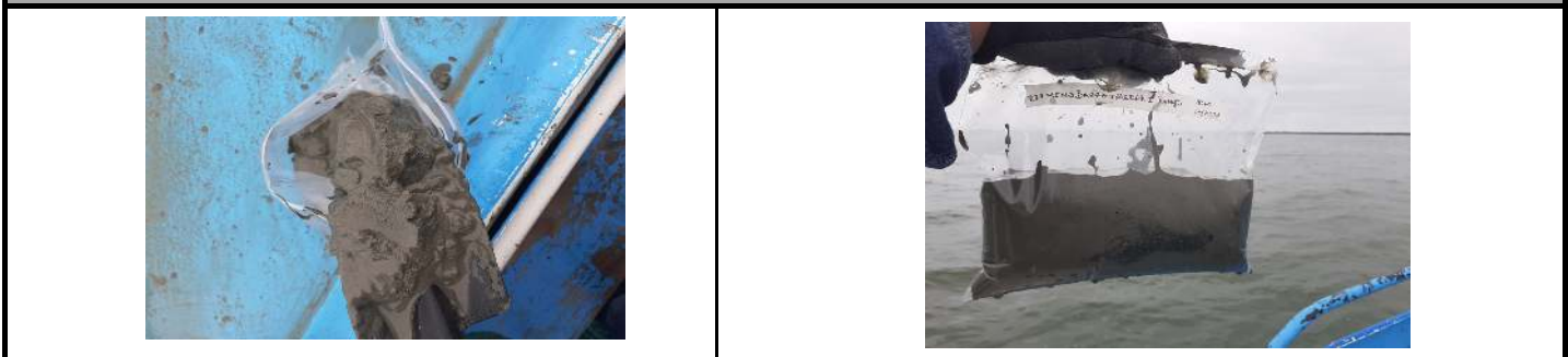
Fotografía 1. Apariencia de la muestra