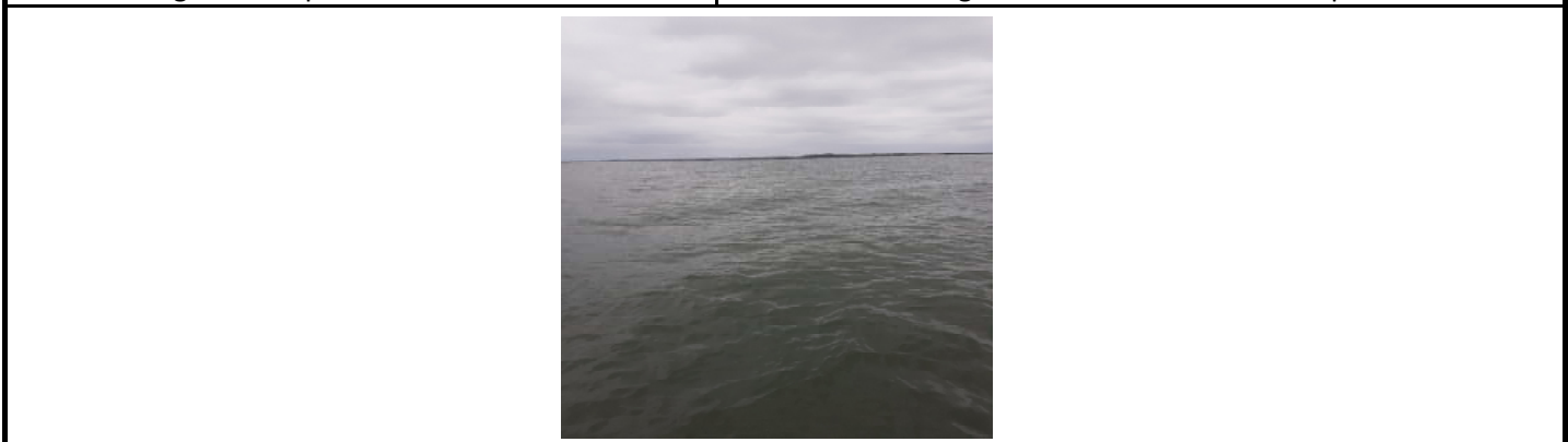
Fotografía 3. Sitio del muestreo (Altama mar)