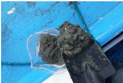
Fotografía 1. Apariencia de la muestra