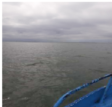
Fotografía 3. Alta mar (Sitio de muestreo)