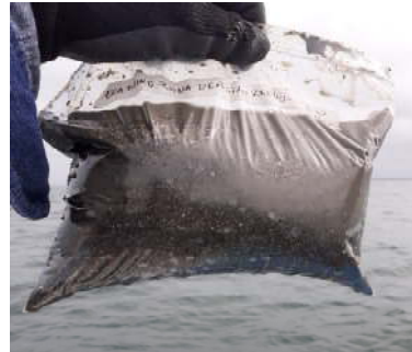
Fotografía 2. Muestra en funda ziploc